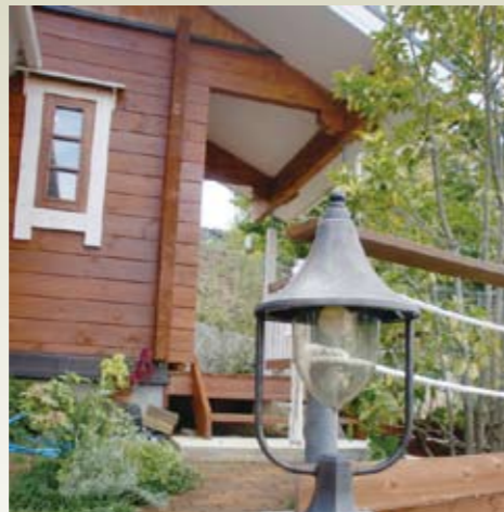
自慢のエクステリア。小物もおしゃれ